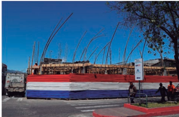
Casa en construcción