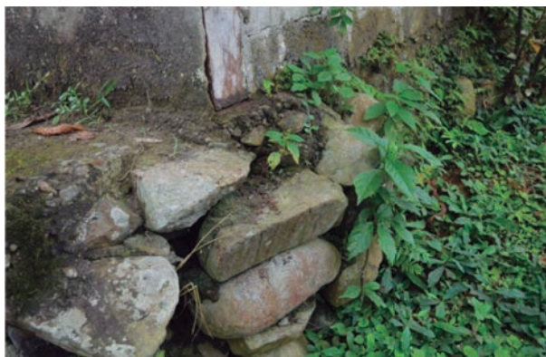
Autor: Freddy Paredes Avilés, 2014.

En la fotografía 8 se aprecia las rocas de los muros ancestrales, utilizadas en el cimiento de la escuela, varios cientos de metros de esta estructura fueron deshechos y reutilizados, y quedan como remanentes la construcción de dos piscinas ancestrales, que, según el doctor Holger Jara, tienen factura inca, su dique no está claramente identificado, puesto que tiene una argamasa que