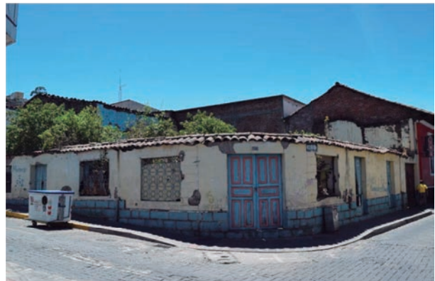
Casa patrimonial destruida