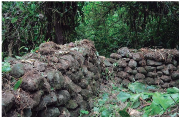
Muros de la ciudad ancestral