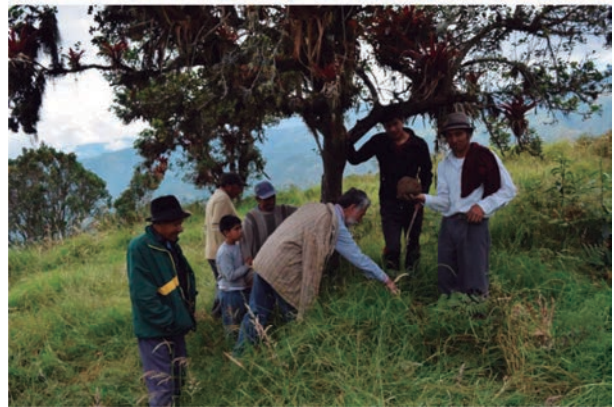
Construcción inca, ingapirka