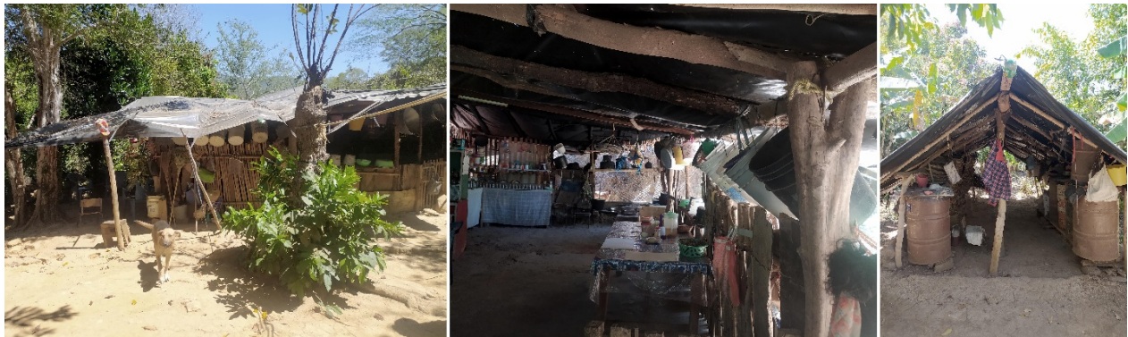
FIGURA 10 Casas y espacios de guardado construidos con madera y plástico

Nota: las fotografías fueron tomadas en la calle principal durante el Festival del Café.