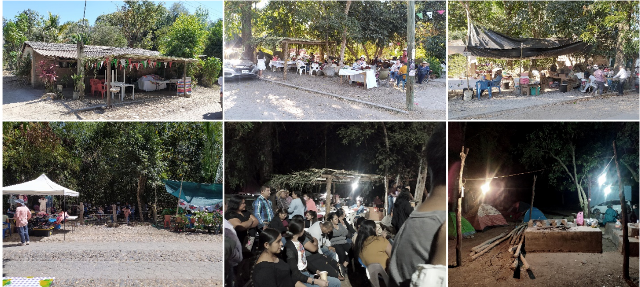
FIGURA 9 Espacios de sombra en Cuzalapa

Nota: las fotografías fueron tomadas en la calle principal durante el Festival del Café.