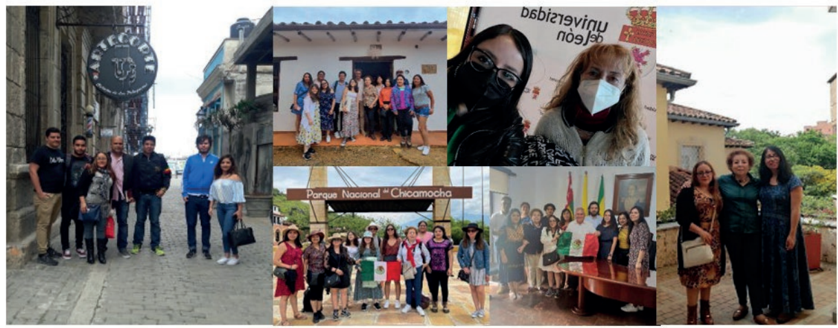
FIGURA 6 Estancias en iniciativas que forman parte de “Mujeres por el Patrimonio”

realización de estancias de investigación para un acercamiento a procesos metodológicos en otros países que han obtenido resultados favorables (figura 6).