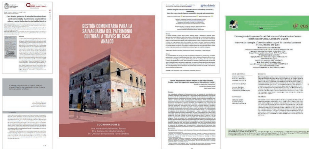
FIGURA 5 Publicaciones con integrantes de “Mujeres por el Patrimonio”