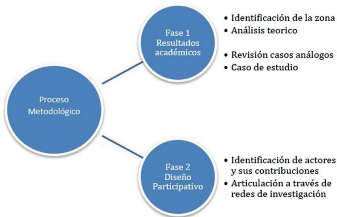
FIGURA 1 Proceso metodológico